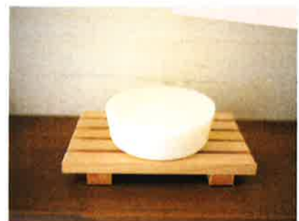
約80gの固形石けんが 完成します！

Eメールにて、下記メールアドレスへ ①ご希望日 ②参加希望人数 ③ご氏名 ④電話番号 をご記入の上、メールにてお申込みください inquiry@lechene-cosme.com